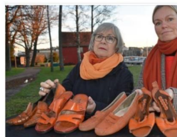
FRITIDSNYTT.NO Aksjonsdager i Kristiansand starte Oransjedagen setter fokus på vold